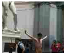
Uomo si spoglia davanti al David di Michelangelo a Firenze