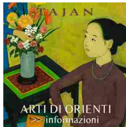
ARTI DI ORIENTI >>> informazioni