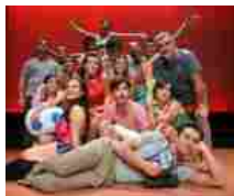
Le Bal. Fino al 29 ottobre si balla al Teatro Menotti di Milano